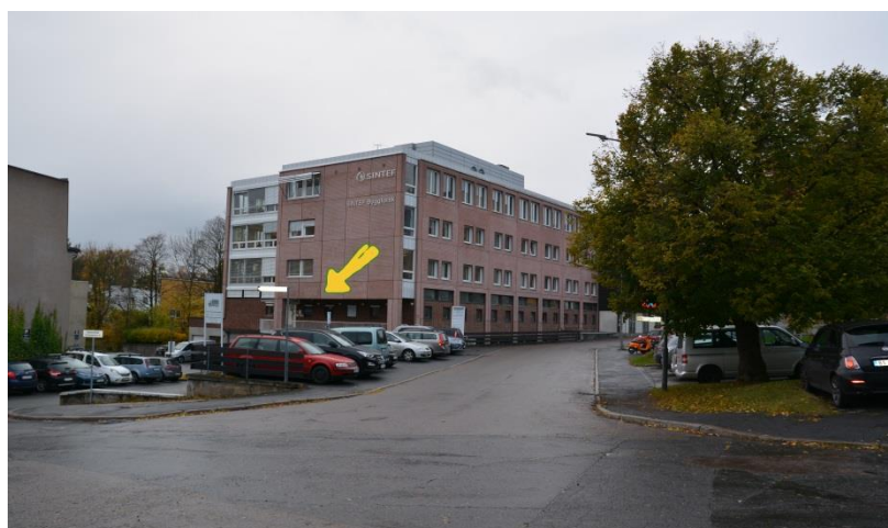
Inngangen til senteret, sett fra Forskningsveien